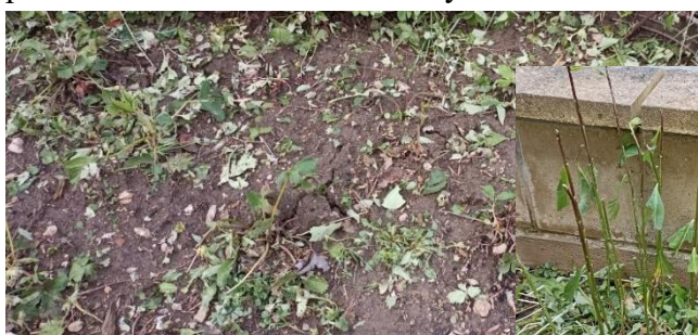
To bývaly jahody